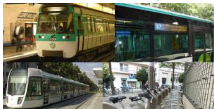
Bus - Tram - Métro – Train

Ce sont des moyens de transport collectifs financés par les villes, les départements, les régions, et qui permettent de transporter un grand nombre de personnes en même temps.